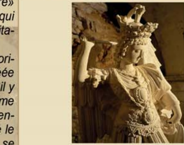
Statue de Saint Michel | St. Michael's statue | Statue San Michele | Estatua de San Miguel

En descendant de nombreux escaliers on rejoint deux «terrasses» à droite et à gauche de l'escalier; selon la tradition ces deux terrasses avaient la fonction d'abriter les autorités et un petit orchestre pendant la célébration de la sainte Messe.