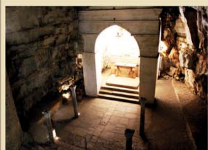
Ciborium autel | Altar ciborium | Ziborium Altar | Altar tabernáculo

El vestíbulo neoclásico, en el arquitrabe de la puerta está escrito "Quis ut Deus" (transcripción latina del nombre judío Mikael), fue edificado en el principio del 1900. Atravesando la rampa de escaleras a la derecha es posible notar un paramento de el altar; a izquierda hay un balcón con un comedero de toba, obtenida de un antiguo altar en el muro; también a la derecha hay un nicho con ornamentaciones florales sobre las paredes laterales y atrás la imagen del SS Crucifijo que se venera en la Iglesia Madre. Descendiendo, a la derecha y a la izquierda dos imponentes