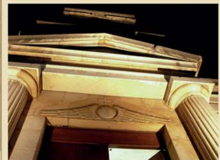
L'entrée de la grotte | The entrance to the cave | Der eingang zur grotte | La entrada de la cueva

Au-dessus de l'entrée en pierre on trouve un clocher et une phrase latine: «Quis ut Deus?», qui est la transcription latine du nom hébraïque Mikael. Elle a été édifiée à la fin du XIXe siècle. A gauche de la première volée d'escalier on trouve une ancienne mangeoire ; en descendant une autre volée d'escalier à droite on trouve les restes d'un ancien autel en pierre du XVIe siècle avec une fresque représentant un crucifix noir vénéré dans la ville.