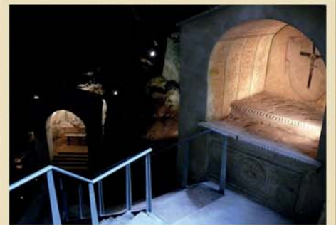
Sanctuaire de SS. Crucifix | Holy Cross altar | Ädikula Heiligen Kreuzes | Nicho SS. Crucifijo

Folgt man der Treppe, sieht man rechts eine Altardecke und links eine Ballustrade mit einer Krippe aus Tuffstein, die aus einem alten Wandaltar herausgearbeitet wurde. Weiter rechts befindet sich